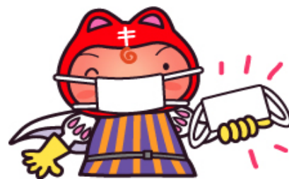
シールぼうやは結核予防のキャラクターです