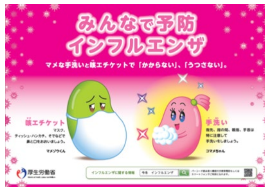
<厚生労働省公式コラボポスター>