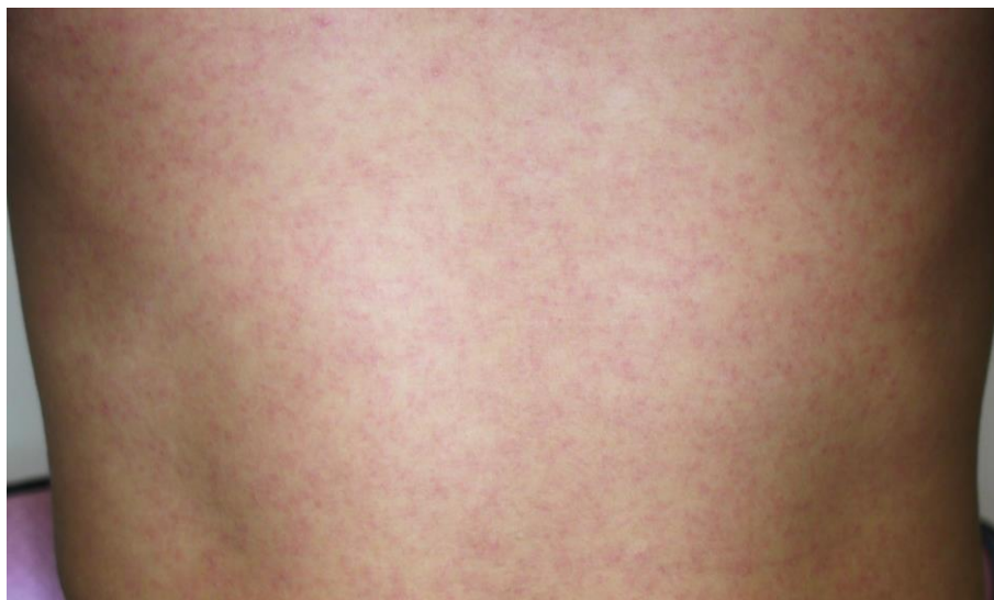
図3. ジカウイルス病の斑状丘疹様の発疹

潜伏期間は、2～12日（多くは2～7日）である。ジカウイルス病の臨床症状は多彩であるが、斑状丘疹様の発疹（ 図3 ）は90～100%に認められるのに対して、発熱の頻度は35～65%とされており 25,45,46 、またこの発疹は掻痒感を伴うことが多いとされている。なお、大半の症例は入院を必要としなかった。 表7 に2015年のブラジル・リオデジャネイロにおけるジカウイルス病患者が発症後4日以内に認めた臨床症状を示す 45 。